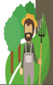
เกษตรกรรมา

ผู้เสียภาษีป้าย คือ ผู้เป็นเจ้าของป้าย และผู้ครอบครองป้าย ยื่นแบบและชำระภาษีป้าย ตั้งแต่เดือนมกราคม – มีนาคม 2565