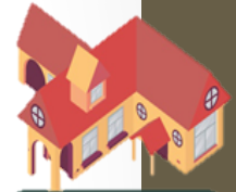
ที่อยู่อาศัย